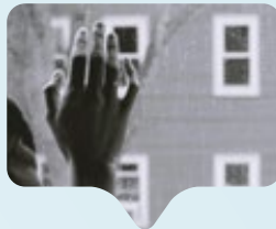
Il dolore delle donne resta spesso invisibile

Il suicidio resta uno dei temi più silenziosi della salute mentale femminile. Eppure i dati raccontano una realtà preoccupante: secondo l'Organizzazione Mondiale della Sanità, ogni anno oltre 720 mila persone muoiono per suicidio nel mondo e, tra le giovani tra i 15 e i 29 anni, rappresenta una delle principali cause di morte. Dietro ai numeri emergono fattori ricorrenti: depressione, violenza domestica, discriminazioni, isolamento sociale e forte pressione culturale. In molti Paesi il disagio psicologico femminile continua a essere sottovalutato o nascosto per vergogna. L'OMS sottolinea come stigma e paura del giudizio impediscano spesso alle donne di chiedere aiuto. Secondo studi internazionali, il fenomeno colpisce in modo particolare adolescenti e giovani donne, aggravato negli ultimi anni da social network, ansia da prestazione e solitudine. Parlarne apertamente significa rompere un doppio tabù: quello della salute mentale e quello della fragilità femminile.