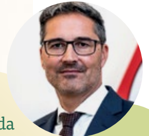
ARNO KOMPATSCHER Landeshauptmann

Nia da odëi, mo da na gran forza. Tabus prägen Denken und Verhalten – oft unbemerkt. Damit bilden sie gesellschaftliche Realitäten ab und können Stereotype festigen. L'attuale numero di ères dimostra quanto sia importante mettere in discussione consapevolmente queste barriere e superarle.