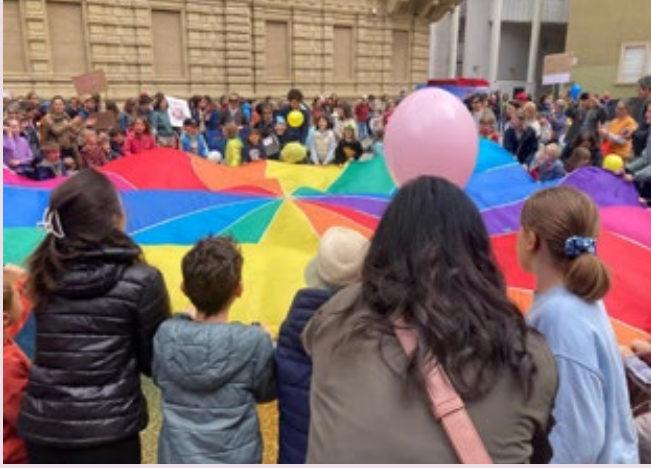
Themen in den Mittelpunkt gerückt, die oft unter den Tisch gekehrt werden, hat die Familiendemonstration Mitte Mai in Bozen