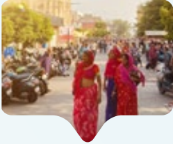
Gemeinsam stark

Die Polizei sieht weg, deshalb nehmen die Frauen die Sache selbst in die Hand: In den ländlichen Regionen Nordindiens, in denen Korruption und Gewalt gegen Frauen zum Alltag gehören, leistet die „Gulabi Gang“ Widerstand. Bewaffnet mit Bambusstöcken setzt sich dieser Zusammenschluss von zehntausenden Frauen gegen häusliche Gewalt, Kinderehen und soziale Ungerechtigkeit ein. Ihr Ziel ist nicht Selbstjustiz, sondern die Durchsetzung geltenden Rechts: Sie zwingen untätige Polizisten zur Arbeit und stellen gewalttätige Ehemänner öffentlich zur Rede. Die Bewegung ist an ihren leuchtend pinkfarbenen Saris erkennbar – ein Symbol für weibliche Kraft und Solidarität. Die Farbe Pink steht hier nicht für Sanftmut, sondern für eine Revolution der Gerechtigkeit und für Frauen, die ihr Leben selbst in die Hand nehmen. Denn gemeinsam brechen diese Frauen starre Machtstrukturen auf.