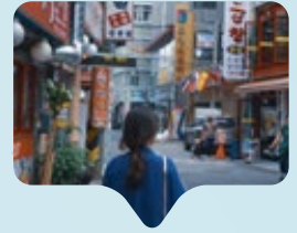
Giappone e Corea del Sud: il tabù delle donne che rifiutano maternità e matrimonio

In Corea del Sud e Giappone cresce il numero di donne che scelgono di non sposarsi e di non avere figli. Una decisione che, oltre alla crisi economica e al costo della vita, viene sempre più spesso descritta come una ribellione alle