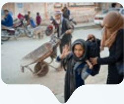
Non è un paese per studentesse

In Afghanistan essere una ragazza e voler studiare è oggi un atto quasi proibito. Da quando i talebani sono tornati al potere nel 2021, oltre 2,2 milioni di ragazze sono state escluse dalle scuole secondarie e dalle università. Le donne non possono frequentare molti luoghi pubblici, lavorare in numerosi settori o viaggiare senza accompagnatore maschile. Secondo le Nazioni Unite, sono più di 70 i decreti che hanno limitato libertà e diritti femminili negli ultimi anni. Ma il dato più forte è forse un altro: il sapere è diventato un tabù. In un Paese dove metà della popolazione viene silenziata, l'istruzione femminile è vista come una minaccia. Eppure, nonostante i divieti, molte ragazze continuano a studiare in segreto, nelle case private o online, rischiando punizioni e arresti. Dietro le immagini dei burqa e delle classi vuote c'è una battaglia culturale enorme: quella contro la paura delle donne istruite, autonome e visibili.