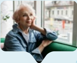
Abenteuerlust im Alter

Eine besondere Form des modernen Ehrenamts ist das Modell „Granny-Au-pair“. In dieser Rolle leben Frauen für mehrere Monate bei Gastfamilien auf der ganzen Welt und helfen dort als Leihomas tatkräftig mit. Die Motive sind vielfältig: pure Abenteuerlust, echter Kulturaustausch und der Wunsch, die eigene Lebenserfahrung sinnvoll weiterzugeben – insbesondere, wenn die eigenen Enkel weit weg sind oder fehlen. Die Gastfamilien gewinnen dabei weit mehr als eine Betreuungshilfe, denn sie profitieren von der Souveränität und Herzenswärme der Leihomas. Doch auch für die Frauen selbst ist die Reise ein Gewinn: Die neue